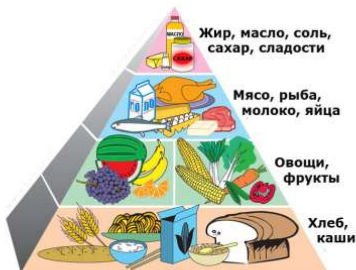
Пирамида здорового питания

К составлению полноценного рациона школьника требуется глубокий подход с учетом специфики детского организма. Освоение школьных программ требует от детей высокой умственной активности. Маленький человек, приобщающийся к знаниям, не только выполняет тяжелый труд, но одновременно и растет, развивается, и для всего этого он должен получать полноценное питание. Напряженная умственная деятельность, непривычная для первоклассников, связана со значительными затратами энергии.